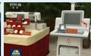
2018年荣获CCTV 新闻联播隆重报道