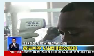
2014年入选中国政府 援非物资采购名录