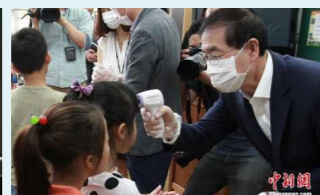
2015年入选韩国政府 采购名录