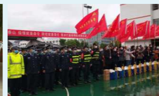
2020年新冠疫情期间 为省政府直接接管企业